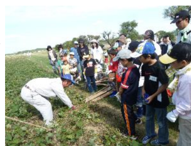
食とスポーツ教室