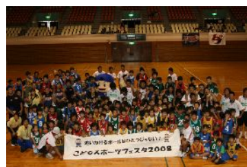
子どもスポーツフェスタ