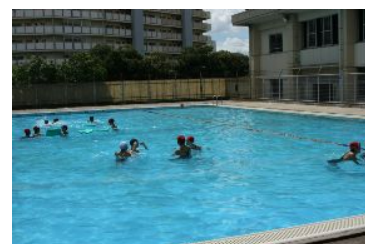
学校プール開放事業