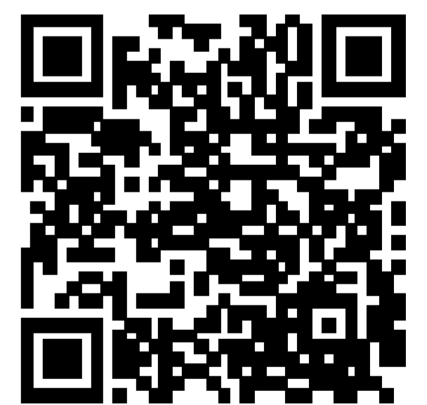
QRコード 【市民体育館HP】