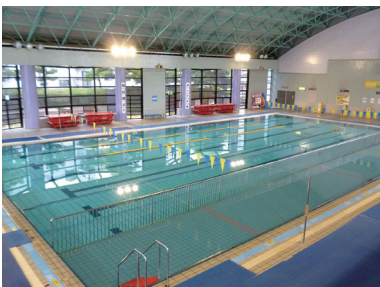
メインプールは深さ1.3mで泳ぎやすく、天井も高いので開放感たっぷり泳げます！