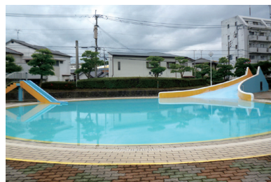
屋外プールには大小2つのスライダーがあり、子供たちに大人気！（夏休み期間中のみ）