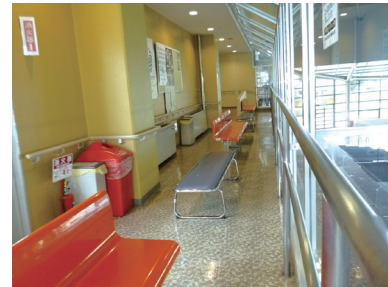
見学スペースも広く、プール全体を見渡せます。