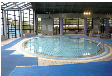
屋内幼児プールを完備。うきわも使えます！