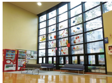
季節に応じて、ロビーの飾りつけを行っています！